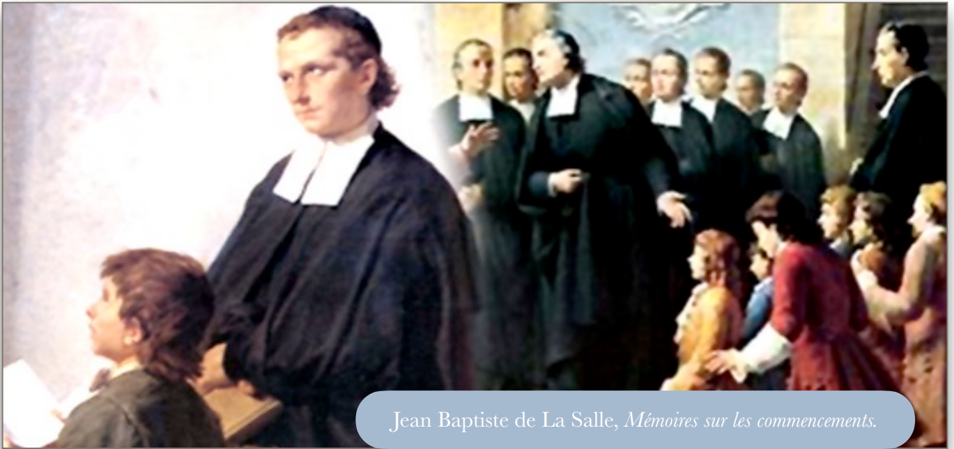
Jean Baptiste de La Salle, Mémoires sur les commencements .